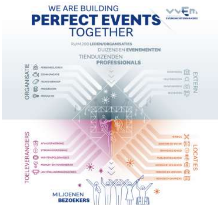
Figuur - VVEM Factsheet Evenementen

De eerste stappen moeten nu gezet worden. Het is van groot belang de bestaande organisatoren, locaties en leveranciers met hun medewerkers (werkzaam in een zeer breed scala, denk aan podiumtechniek, horeca, evenementen- en festivalbeveiliging), weer aan het werk te helpen. Er is de zeer grote poule zzp'ers , die willen we ook zo snel mogelijk weer aan de slag krijgen. Onze belangrijkste motivatie deze industrie weer op gang te helpen is dat we ons verantwoordelijk voelen voor onze bezoekers en medewerkers. Zij moeten erop kunnen vertrouwen dat we samen mooie evenementen en festivals organiseren, produceren en vooral beleven.